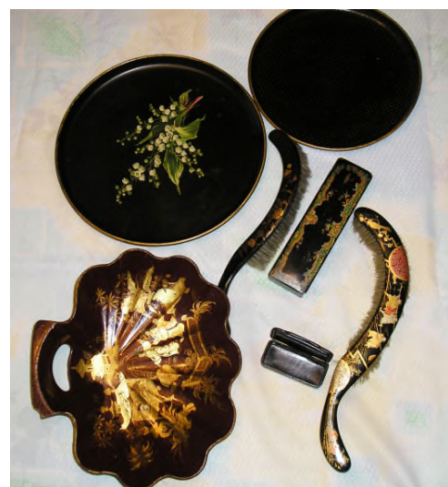
Objets en carton laqués

> 18h, aux Archives départementales de la Haute-Marne à Chaumont/Choignes Entrée libre