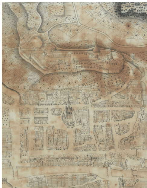
Extrait du plan géométral de la Ville de Joinville de 1789, Mairie de Joinville.