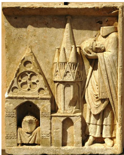
Saint Didier céphalophore, bas-relief issu du tombeau de saint Didier, calcaire, vers 1240-1260. Coll. Musée d'Art et d'Histoire de Langres