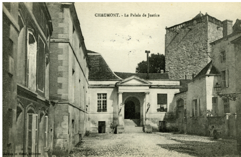
Chaumont, le Palais de Justice. Carte postale ancienne, ADHM, 8 Fi 122/135.

La conférence s'attachera à les présenter au public tout en les resituant dans le contexte des institutions d'Ancien Régime, et en indiquant quelques perspectives de recherche.