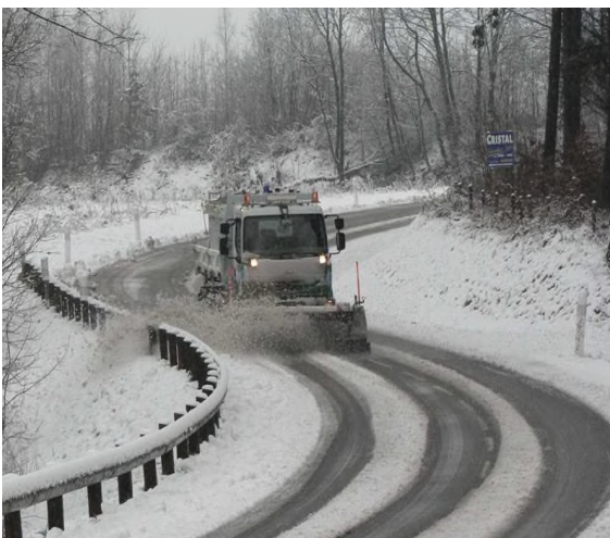
en journée (pas de neige sur les passages de roue)

Pour les cas de neige, les camions raclent et traitent des circuits prédéfinis jusqu'au retour aux conditions de circulation suivantes :