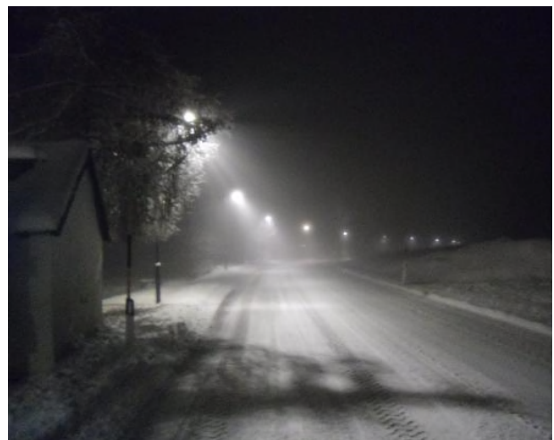
de nuit (faible épaisseur de neige circulable sur toute la chaussée)