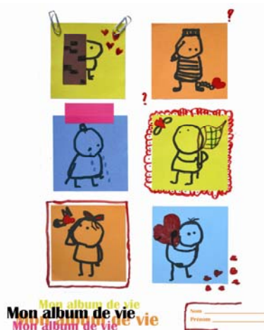
Ethan – 7 ans