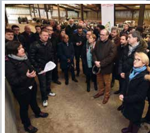
Visite du GAEC de Pomerol avec Jean Rottner, Président de la Région Grand Est, le 17 février 2018

Mais, au-delà de cette convention traitant spécifiquement de la question des investissements, d'autres partenariats peuvent être établis avec la Région Grand Est sur des thèmes plus spécifiques : le développement harmonieux du tourisme ornithologique et de l'activité agricole ou encore l'indemnisation des exploitations victimes des dégâts causés sur les cultures suite à des phénomènes météorologiques.