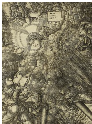
Détail d'une gravure de Jean Duvet. Bibliothèque municipale de Dijon, est. 2013 bis.

> Aux Archives départementales de la Haute-Marne à Chaumont/Choignes à 18h