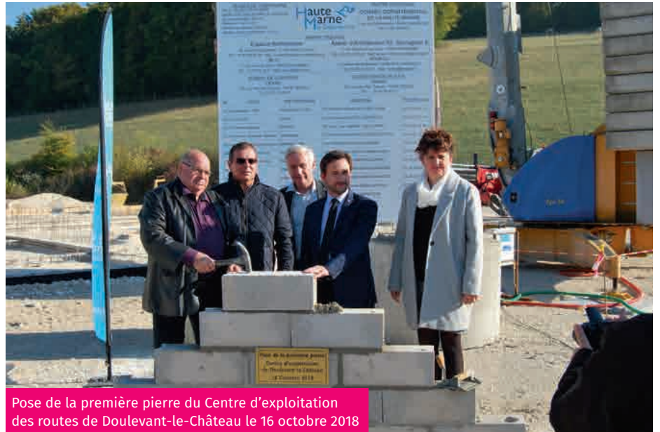
Pose de la première pierre du Centre d'exploitation des routes de Doulevant-le-Château le 16 octobre 2018

Chaussées : 8,1 M€ Ouvrages d'art : 3,7 M€ Opérations de sécurité : 2,3 M€ Acquisition de véhicules, d'engins et de matériels : 2 M€