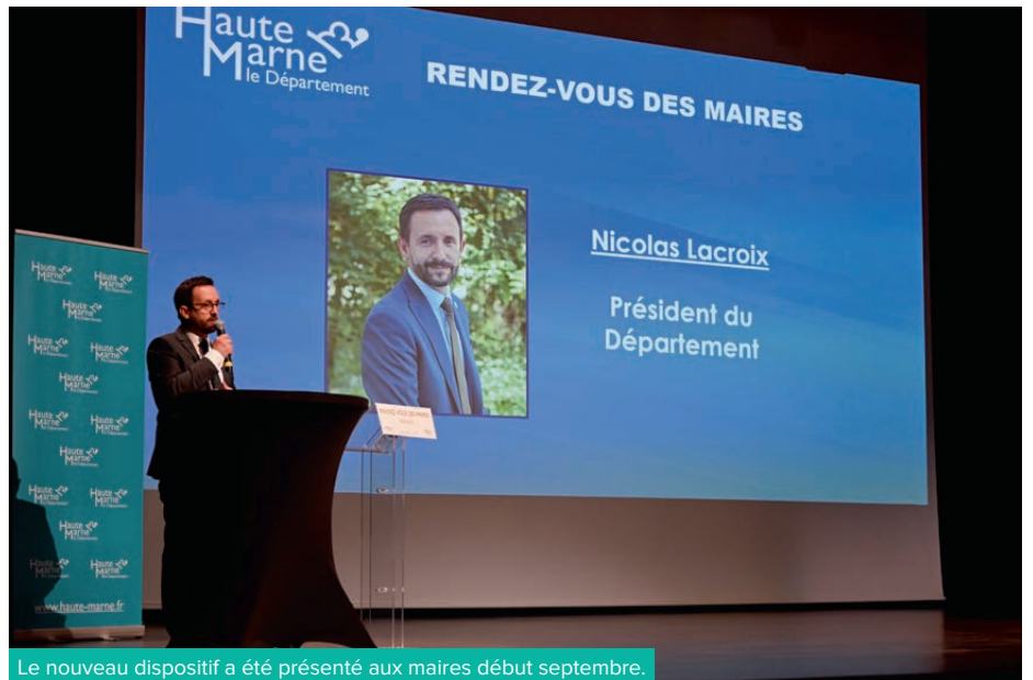
Le nouveau dispositif a été présenté aux maires début septembre.