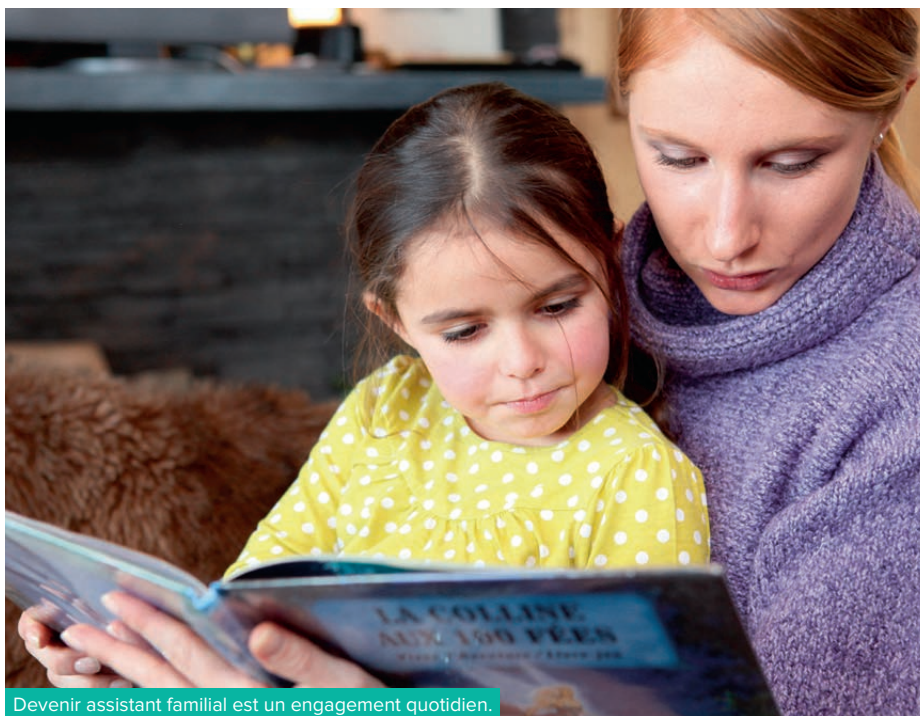
Devenir assistant familial est un engagement quotidien.

1 re Vice-présidente en charge du pôle des solidarités, déléguée à l'insertion sociale, à la protection de l'enfance et à la santé