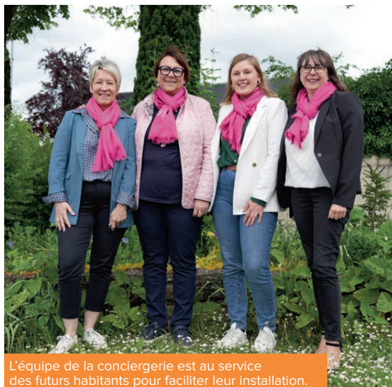
L'équipe de la conciergerie est au service des futurs habitants pour faciliter leur installation.

À l'Agence d'attractivité de la Haute-Marne, le Pôle relations entreprises est à disposition des sociétés, des associations et des collectivités du département et les aide dans leurs recrutements. De l'autre côté, le Pôle Conciergerie se charge des familles souhaitant s'installer en Haute-Marne. Quand leur besoin recoupe celui des entreprises, le département à tout à y gagner.