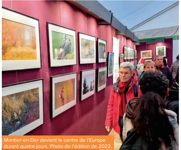
Montier-en-Der devient le centre de l'Europe durant quatre jours. Photo de l'édition de 2023.

La 27 e édition du Festival Photo Montier se déroulera du 21 au 24 novembre à Montier-en-Der. Il est le rendez-vous incontournable des passionnés, amateurs et professionnels de la photo et de la nature grâce à la présence des plus grands photographes, scientifiques et naturalistes du monde entier.