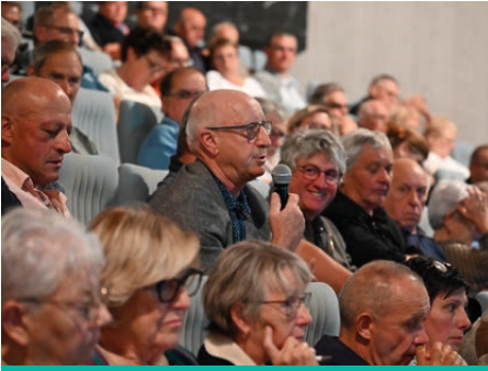
Les échanges avec les maires ont été nombreux.

Le soutien financier du Département se traduira par des dispositifs simples et ciblés, un budget sanctuarisé et un partenariat de proximité. L'ingénierie départementale est maintenue pendant toute la durée du pacte.