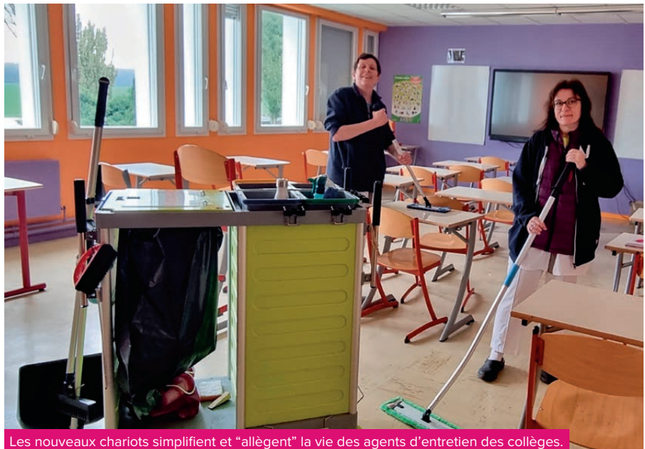
Les nouveaux chariots simplifient et "allègent" la vie des agents d'entretien des collèges.

Fini les traditionnels seaux rouges et bleus de plus de 15 litres à remplir et à vider, tous les collèges sont équipés de ce nouveau système innovant.